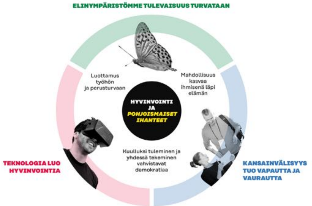
Kuva 3. Hyvinvoinnin seuraava erä arjen kokemuksena.

Hyvinvoinnin seuraavassa erässä uusi työ ja työelämä näyttäytyvät mahdollisuutena ja ihmiset voivat luottaa perusturvaan, joka kantaa elämäntilanteesta riippumatta. Jokaisella tulisi olla mahdollisuus oppia ja kasvaa ihmisenä läpi elämän. Toimiva demokratia, nähdyksi ja kuulluksi tuleminen, dialogi ja yhdessä tekeminen vahvistavat osallisuutta ympäröivään yhteiskuntaan. (Kuva 3.)